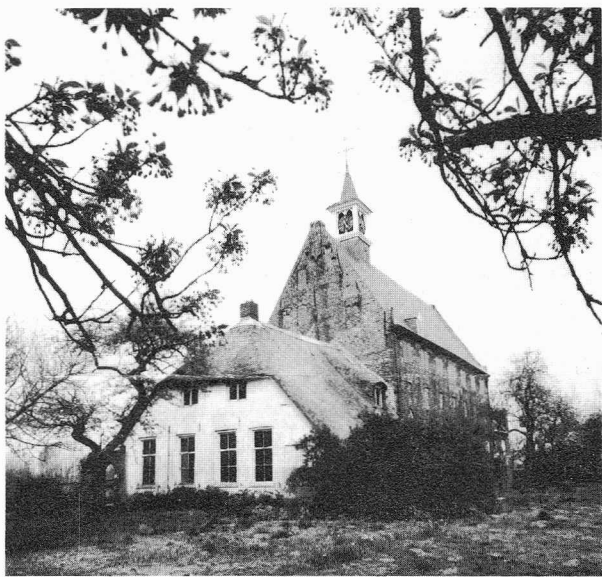
Restant van het klooster Windesheim

ZUTPHEN Stedelijk Museum: Boekbanden en boekbinden . 9 mei - 14 juni 1987. Naast een historisch overzicht van de boekband en boekbindtechnieken worden moderne boekbanden van het Vlaamse Handboekbindersgilde getoond. -- zie ook bij Varia.