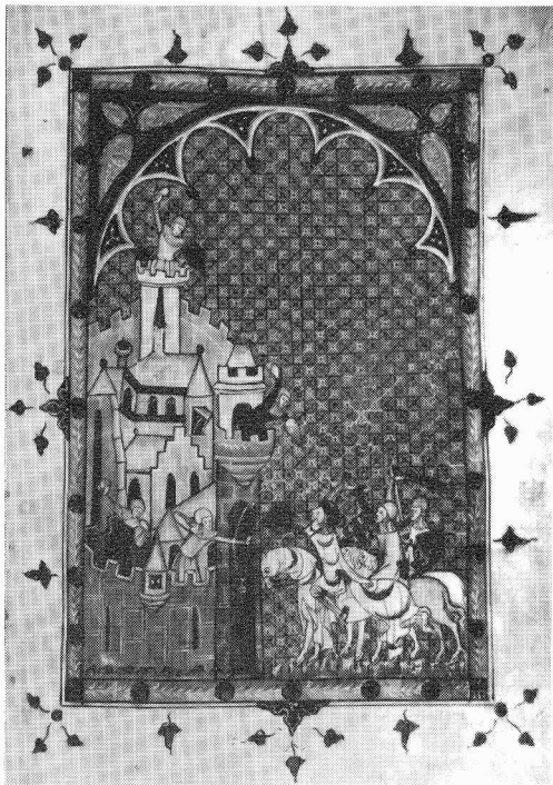
De verovering van Jeruzalem. Het Gronings-Zutphense Maerlanthandschrift. Groningen, UB, Hs. 405. Te zien aldaar.

land. Teksten: Jos.M.M.Hermans, Klaas van der Hoek & Lydia S. Wierda. Leeuwarden 1987, 40 pp. gefll, omslag in kleur. ISBN 90-9001675-9. Dfl. 7,50 (por-to inbegrepen).