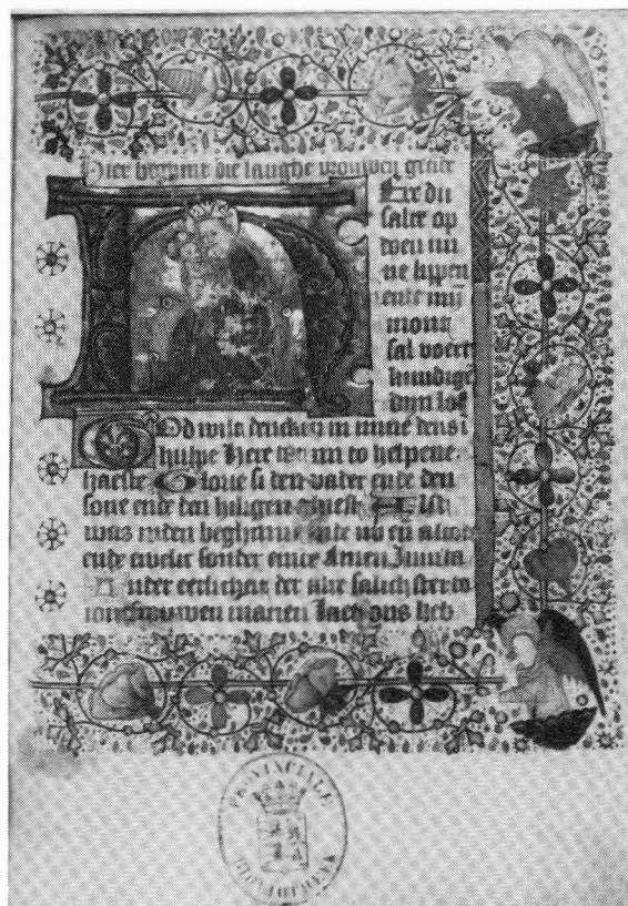
Getijdenboek, toegeschreven aan de Agnietenberg. Leeuwarden, PB, 689 Hs. Te zien aldaar.

GRONINGEN Universiteitsbibliotheek: De wereld aan boeken . 21 mei - 31 augustus 1987. Catalogus. Overzicht van handschriften en drukken uit diverse vakgebieden, getoond b.g.v. de officiële opening van de UB.